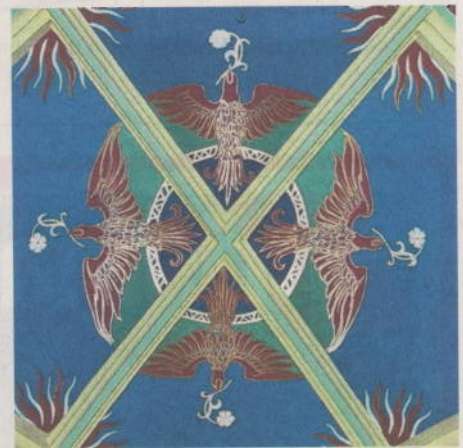
Deckendetail im Eingangsbereich.