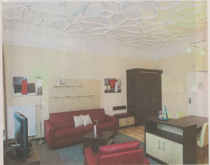
Stuckdecke in einem der Apartments.