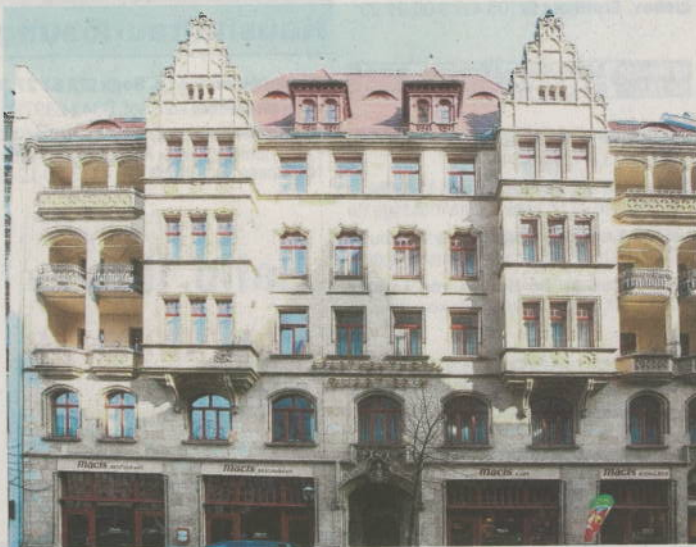
Das Apartment-Haus in der Markgrafenstraße.